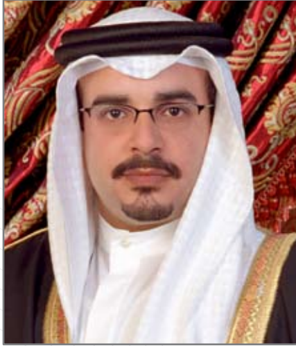
صاحب السمو الشيخ سلمان بن حمد آل خليفة ولي العهد نائب القائد الأعلى لقوة دفاع البحرين