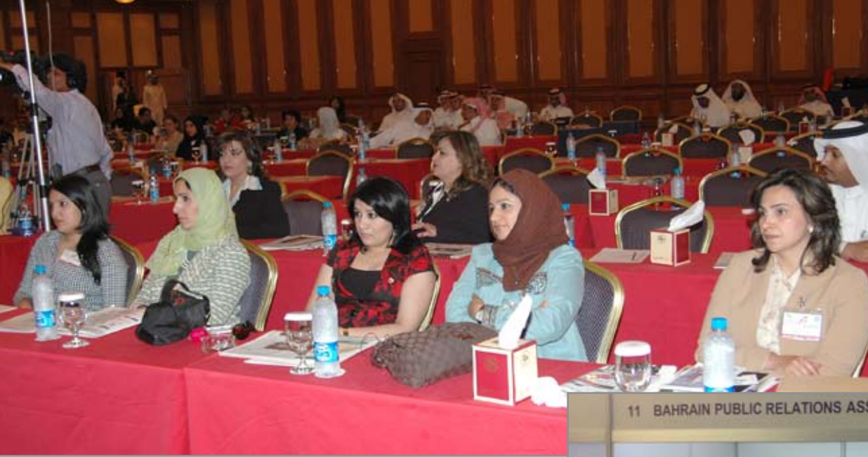
11 BAHRAIN PUBLIC RELATIONS ASSOCIATION (BPRA)