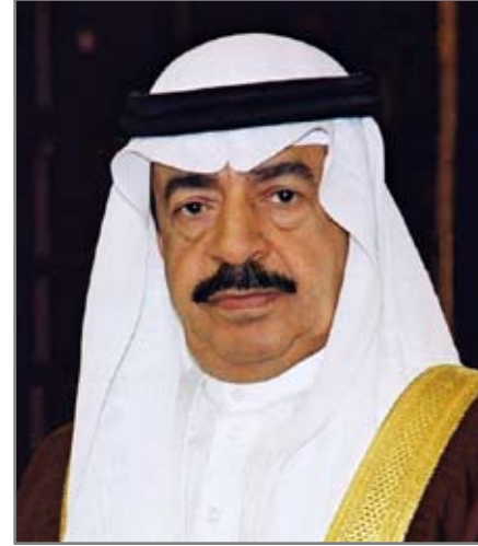
صاحب السمو الشيخ خليفة بن سلمان آل خليفة رئيس مجلس الوزراء