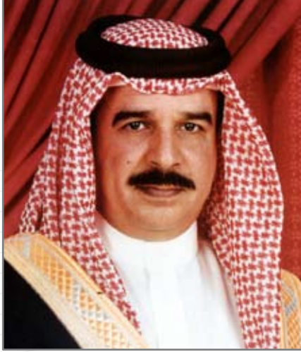
حضرة صاحب الجلالة الملك حمد بن عيسى آل خليفة ملك مملكة البحرين