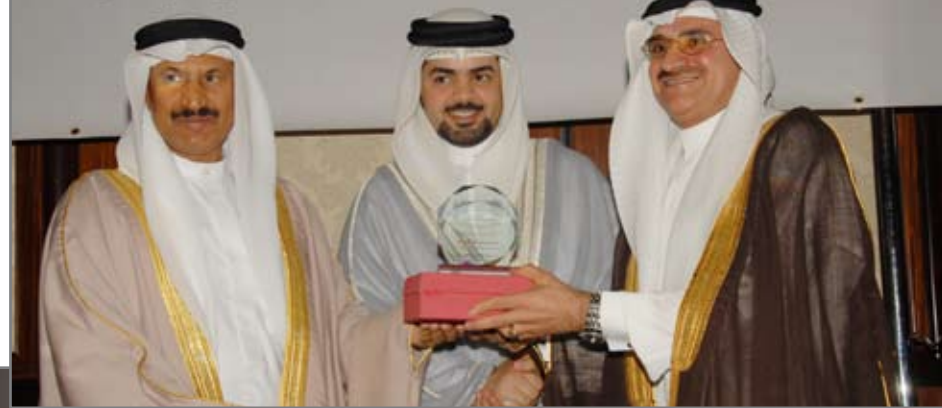
فندق كراون بلازا - مملكة البحرين