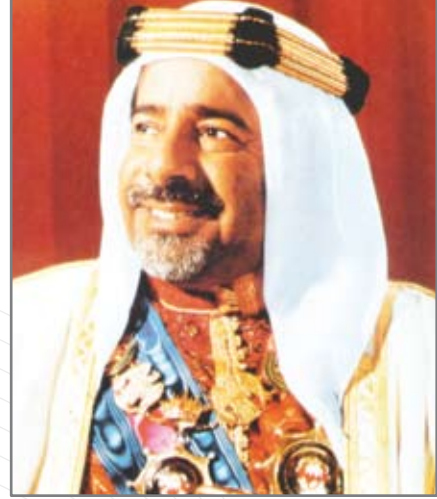
المغفور له بإذن الله تعالى صاحب السمو الشيخ عيسى بن سلمان آل خليفة أمير البلاد الراسل